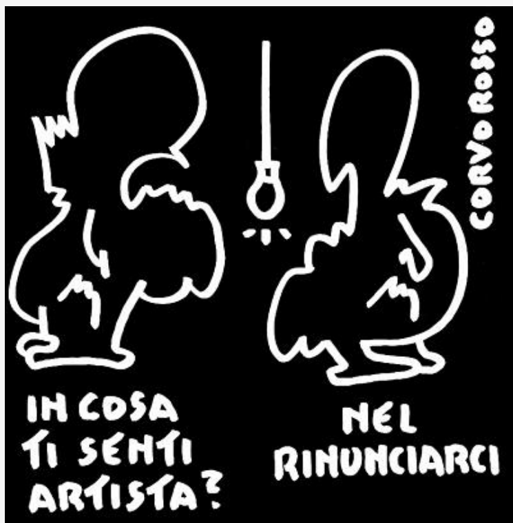
Gli Inesistenti: le Vignette di Corvo Rosso