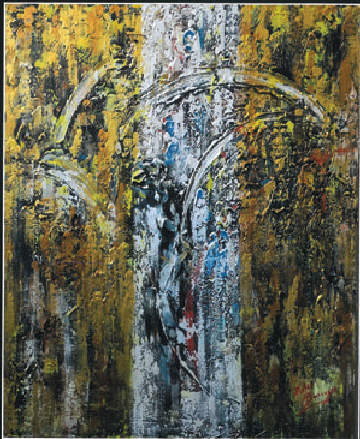
Lael e scintille , 2015, acrilico su tela, cm. 100 x 120